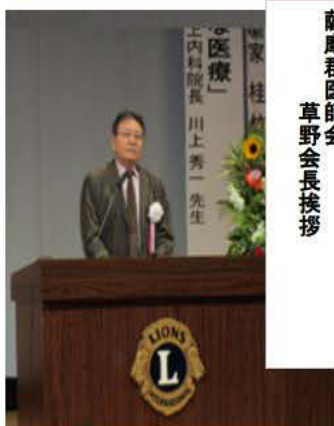
薩摩郡医師会 草野会長挨拶