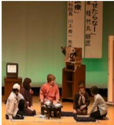
「地元劇団」がいからげによる 「わが家にもといがなった 花子ばあちゃん」