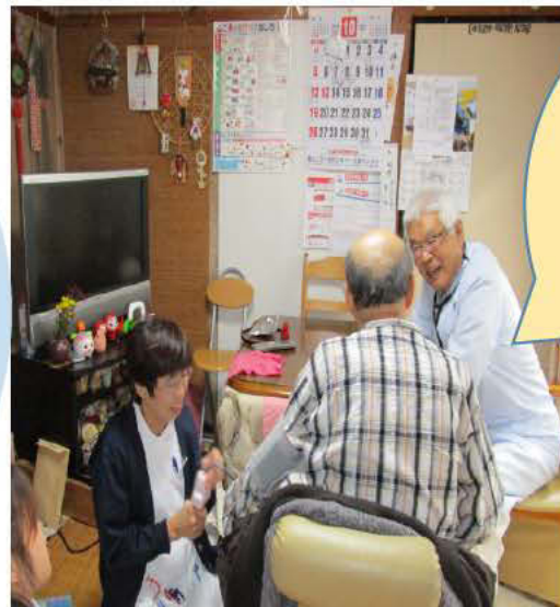
木原医院 木原先生 往診風景