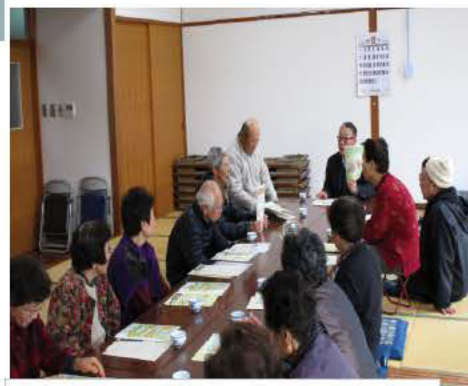
12月11日 湯之元ふれあいまそ会 松下事業運営委員長説明

その他にも色々なサロンで「在宅医療ってなあに」のパンフレットに基づく説明を行い、多くの方の地域住民の方の参加を頂きました。また、説明には推進チームメンバーの方々に協力を頂きました。12月末現在20箇所実施いたしました。今後もサロンへの出前講座は継続していきます。